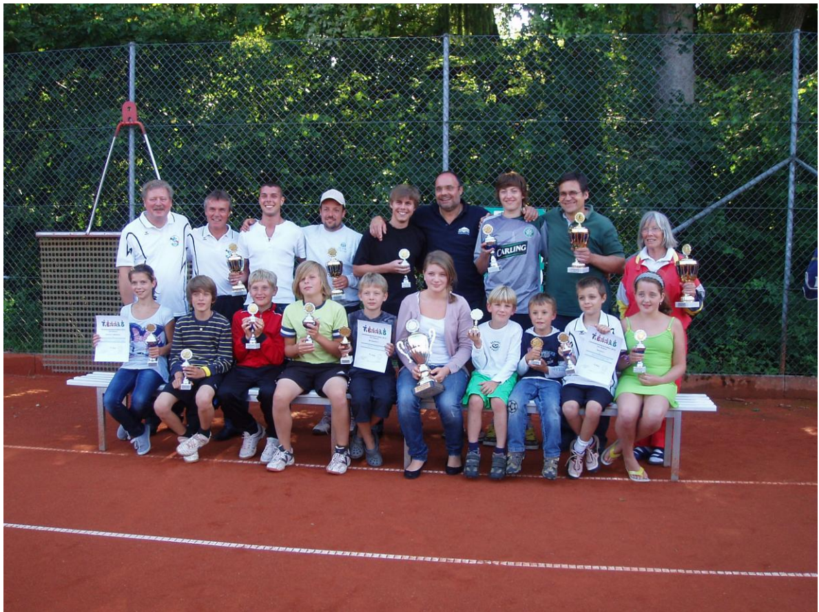
Unsere Vereinsmeister 2010

Das Fussball-Tennis-Turnier wurde wieder mit großem Kampfgeist und noch mehr Spass zusammen mit den Boca Seniors durchgeführt. Ein Freundschaftsspiel mit unseren Uffinger Tennisfreunden fand ebenfalls wieder statt und war -wie jedes Jahr- sehr schön.